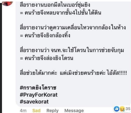
ภาพที่ 1 การแสดงความคิดเห็นของผู้ชมที่แสดงออกผ่านทางแอปพลิเคชัน (นครินทร์ ศรีจันทร์, 2563)