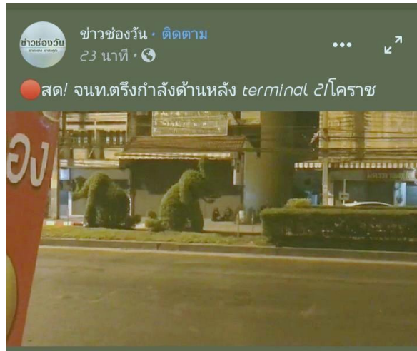
ภาพที่ 2 การถ่ายทอดสดจาก Terminal 21 โคราช (ข่าวช่องวัน, 2563)