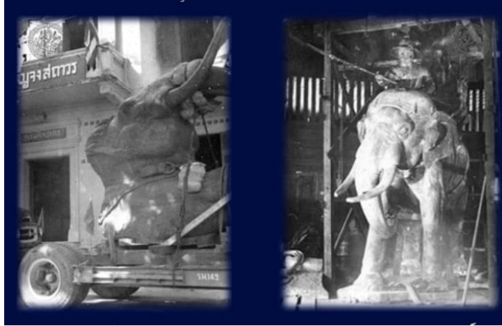
ภาพที่ 4 ภาพการสร้างพระบรมราชานุสาวรีย์สมเด็จพระนเรศวรมหาราชทรงพระคชาธารออกศึก หล่อด้วยสัมฤทธิ์ถือพระแสงของ้าวหล่อด้วยโลหะรมดำ ฐานล่ำสลักภาพนูนต่ำ ซึ่งเป็นภาพยุทธหัตถีและภาพตอนประกาศอิสรภาพ (ทัศนีย์ เทพไชย, ม.ป.ป.)

การก่อสร้างพระบรมราชานุสาวรีย์แห่งนี้ มีลักษณะพระบรมรูปสมเด็จพระนเรศวรทรงประทับบนคอช้างศึก พระหัตถ์ทั้งสองทรงแสงของ้าวชี้ไปข้างหน้า ทรงพระมาลาเบี่ยง พระพักตร์มองตรงไปข้างหน้าเฉียงไปทางด้านขวาเล็กน้อย พระพักตร์ดูเด่น เครื่องขีรึม ในลักษณะทำให้พระมหาอุปราชออกมากกระทำยุทธหัตถี อีกประการพระบรมรูปสมเด็จพระนเรศวรทรงไม่สวมฉลองพระบาท ซึ่งวิเคราะห์กันว่าเพราะอาจจะทำให้พระองค์ทรงสามารถบังคับขึ้นบนคอช้างศึกได้ถนัดขึ้น