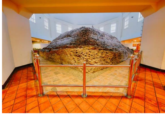
ภาพที่ 1 แสดงซากเจดีย์เก่าจากการสร้างของพระนเรศวร

ในสมัยของพระนเรศวรได้เป็นอย่างดี และเนื่องจากเป็นสถานที่ที่ได้รับการยอมรับถึงความสำคัญในเชิงประวัติศาสตร์ จังหวัดสุพรรณบุรีจึงมีการจัดงานงานเฉลิมฉลองพระบรมราชานุสรณ์ดอนเจดีย์ทุกปี โดยมีกำหนดการจัดงานในวันที่ 18 มกราคม ของทุกปีเพื่อเป็นการเฉลิมฉลองชัยชนะในการทำยุทธหัตถีของพระนเรศวรแล้ว ยังเป็นการฉลองวันกองทัพไทยอีกด้วย