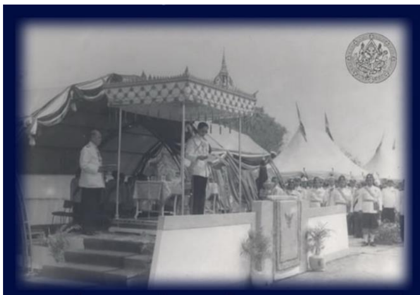
ภาพที่ 5 แสดงพระบาทสมเด็จพระบรมชนกาธิเบศร มหาภูมิพลอดุลยเดชมหาราช บรมนาถบพิตร

ในวันที่ 25 มกราคม พ.ศ. 2502 พระบาทสมเด็จพระบรมชนกาธิเบศร มหาภูมิพลอดุลยเดชมหาราช บรมนาถบพิตร ได้เสด็จพระราชดำเนินทรงเปิดพระบรมราชานุสาวรีย์สมเด็จพระนเรศวรมหาราช ดังนั้น รัฐบาลจึงได้กำหนดให้วันที่ 25 มกราคม ของทุกปีเป็นวันกองทัพไทย โดยถือเป็นวันที่ระลึกในวาระที่สมเด็จพระนเรศวรมหาราช ทรงกระทำยุทธหัตถีกับพระมหาอุปราชาแห่งพม่าและกำหนดให้มีงานรัฐพิธีถวายพวงมาลาเป็นราชสักการะพระบรมราชานุสรณ์ดอนเจดีย์และสมเด็จพระนเรศวรมหาราช ต่อมามีการ คำนวณเหตุการณ์ในประวัติศาสตร์ใหม่ โดยตามประวัติศาสตร์ได้มีการระบุว่า สมเด็จพระนเรศวรมหาราชได้ กระทำยุทธหัตถีเมื่อวันจันทร์ เดือนยี่ แรม 2 ค่ำ ปีมะโรงจุลศักราช 954 (พ.ศ. 2135) นั้นมีความคลาดเคลื่อน จากความเป็นจริง ซึ่งในปี พ.ศ. 2549 คณะรัฐมนตรีมีมติเปลี่ยนวันกระทำยุทธหัตถี ให้ตรงกับวันที่ 18 มกราคม 2135 และถือว่าวันที่ 18 มกราคมของทุกปีคือ วันกองทัพไทย ตั้งแต่บัดนั้นเป็นต้นมา