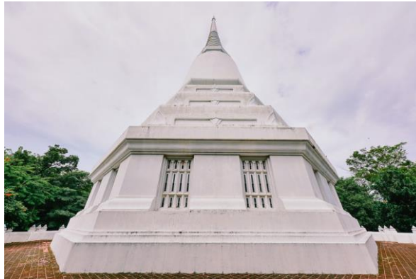
ภาพที่ 2 แสดงเจดีย์องค์ใหม่ที่สร้างครอบเจดีย์องค์เดิม (เอ็งเอย, 2564)