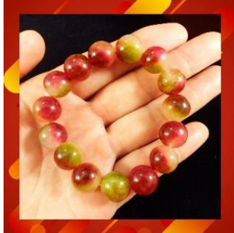
ภาพที่ 12 หยกสามสีแบบฮัก ลัก ชิว (หัวใจพระสูตร, ม.ป.ป.)

คือ ฮัก ลัก ชิว เป็นเทพที่แสดงถึงความปรารถนาสามประการของมนุษย์ ฮัก เป็นสัญลักษณ์ของความโชคดี และความมั่งคั่ง ลัก เป็นสัญลักษณ์ของยศศักดิ์และความสำเร็จ และ ชิว เป็นตัวแทนของความยืนยาว คือ อายุยืนยาว การสวมใส่หินหลายสีนี้เชื่อว่าจะช่วยในการแสวงหาความปรารถนาเหล่านี้