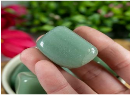
ภาพที่ 10 หยกอินเดีย (Crystalcouncil, n.d.)

10. หยกอินเดีย (India Jade) ไม่ใช่หยกแท้ แต่เป็นหินในตระกูลควอตซ์ คือ กรีนอะเวนจูริน