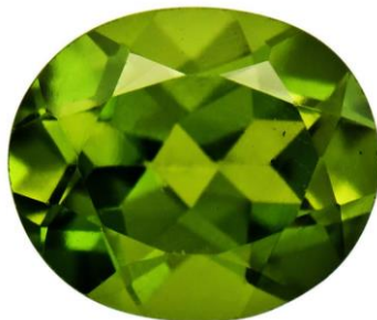
ภาพที่ 6 หยกสหรัฐอเมริกา (Tim Matthews, 2566)

5. หยกสหรัฐอเมริกา (American Jade) มีหลายชื่อเรียก หยกแคลิฟอร์เนีย (California Jade), หยกฟิเธอร์ริเวอร์ (Feather River Jade), หยกแฮปปี้แคมป์ (Happy Camp Jade), หยกปูลกา (Pulga Jade) และหยกเวซูวีอาไนต์ (Vesuvianite Jade) ทั้งหมดเป็นชื่อของหินชนิดเดียวกัน คือ "ไโดเคลสสีเขียว (Green Idocrase)" หรือที่มีชื่อแร่ว่า "เวซูวีอาไนต์ (Vesuvianite)"