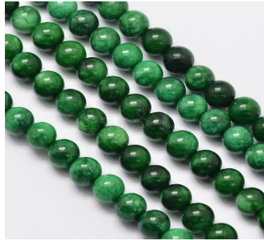
ภาพที่ 7 หยกมาเลเซีย