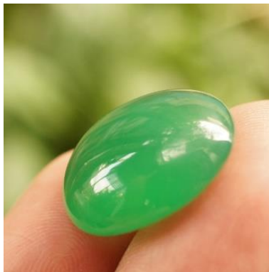
ภาพที่ 3 หยกออสเตรเลีย (BangkokGemstore, ม.ป.ป.)

1. หยกออสเตรเลีย (Australia Jade) จะเป็นแร่ควอตซ์ชนิดเนื้อเนียนละเอียดในกลุ่มชาซิโดนีที่มีมลทินสีเขียวของธาตุ निकเกิล ที่มีชื่อว่า คริสโซเฟลส สีของหินชนิดนี้จะเป็นสีเขียว แอปเปิล กิ่งโปรงแสงจนถึงสีเขียวเข้ม