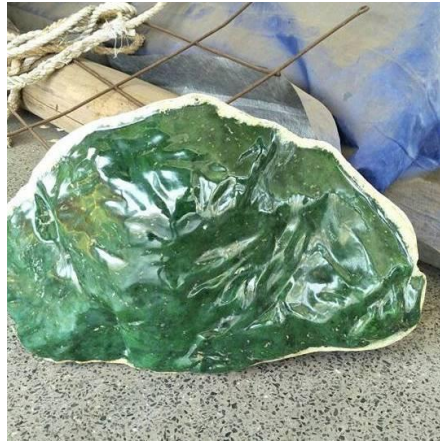
ภาพที่ 1 หยกเจไดต์

(บริษัท แอลดับบลิวเอ็น ทรีตี จำกัด, ม.ป.ป.)