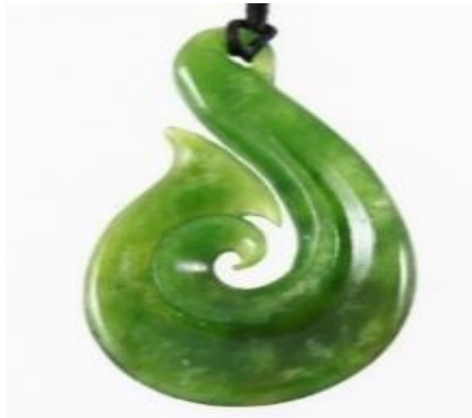
ภาพที่ 16 หยกนิวซีแลนด์

16. หยกนิวซีแลนด์ (New Zealand Jade) หยกนิวซีแลนด์ มีความหมายเป็นหิน 2 ชนิด คือ หยกเนฟไฟต์ และแร้เซอร์เพนทิน ซึ่งมีสีเขียวเหมือนกัน แต่ส่วนใหญ่จะหมายถึงหยกเนฟไฟต์มากกว่า ซึ่งจะใช้แทนด้วยภาษาท้องถิ่นว่า "Pounamu" ที่แปลว่า หินสีเขียวนั่นเอง