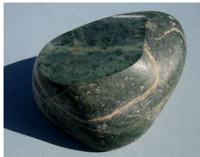
ภาพที่ 13 หยกอลาสกา (ไวน์กับสายน้ำ, 2558)

13. หยกอลาสกา (Alaska Jade) เป็นชนิดของแร่ที่ชื่อว่า "เพ็คโตไลต์ (Pectolite)" ซึ่งเป็นแร่ในตระกูลเดียวกันกับหินลาริมาร์ แต่เป็นสีเขียวที่ขุดขึ้นในรัฐอลาสกา