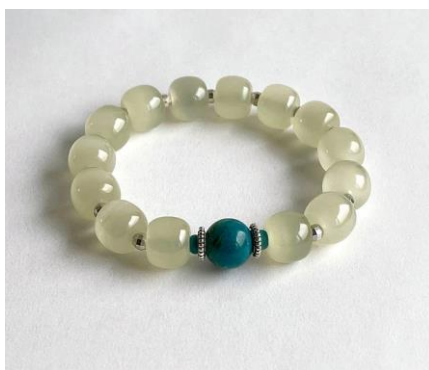
ภาพที่ 4 หยกอฟกานิสถาน (Pinkoi, ม.ป.ป.)

2. หยกอฟกานิสถาน (Afghan Jade) จะเป็นชนิดของหินที่อยู่ในกลุ่มเซอร์เพนทีน ที่มีชื่อว่า "โบวีเนด" มีสีโปรงแสงจนถึงทึบแสง สีขาว สีเขียวอ่อนจนถึงเขียวเข้ม มีสีเหลือง สีดำ รวมถึงสีชมพู