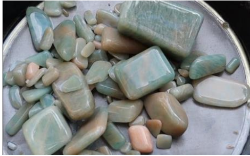
ภาพที่ 9 หยกอิมพิเรียลเม็กซิกัน (MeMiner, 2563)

9. หยกอเมซอน (Amazon Jade) ไม่ใช่หยกแท้ แต่เป็นหยกที่ทำจากหินเฟลด์สปาร์ ซึ่งก็คืออะมาโซไนต์