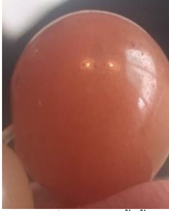
ภาพที่ 17 หยกสีน้ำผึ้ง (PWsalestone, 2561)

จากการศึกษาชนิดของหินหยกที่ใช้ชื่อในทางการค้าพบว่า ในตลาดหินสีในปัจจุบันมีการใช้คำว่า หยก นำหน้าหินสีทั่วไปในตลาดปัจจุบัน เพื่ออ้างอิงหินที่มีสีใกล้เคียงกับหยก หรือหินสีเขียวที่มีลักษณะคล้ายกับหยกธรรมชาติ แต่ไม่ได้เป็นแร่เนฟไฟต์ หรือแร่เจดไตร์ที่แท้จริง เพื่อเพิ่มมูลค่าทางการค้าให้กับหินดังกล่าว