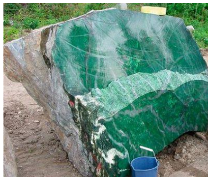
ภาพที่ 2 หยกเนไฟต์

2) หยกประเภทเนไฟต์ เนฟไรท์ นิฟไรท์ (NEPHRITE) มีธรรมชาติเกิดจากแร่แมกนีเซียม คัลเซียม และเหล็ก หรือเป็นแร่ตระกูลแอมฟิโบล มีรูปผลึกแบบโมโนคลินิก หยกเนไฟต์ปัจจุบันพบมากในบริติช โคลัมเบีย ไกล้อะลาสกา ในประเทศแคนาดา มีแหล่งหยกเนื้อดีสีไปไม้สดจนถึงเขียวอมดำจำนวนมากตามบริเวณ เทือกเขาที่มีหิมะปกคลุมชาวโพลนเกือบตลอดปี นอกจากนี้ยังพบที่ไซบีเรีย ประเทศรัสเซีย ก็มีหยกเนไฟต์ แบบเดียวกัน ประเทศแคนาดาเช่นกัน หยกเขียวเนไฟต์จากรัสเซียมีชื่อเสียงรู้จักกันมานาน นอกจากนี้ ยังพบ ในบริเวณตะวันออกของไต้หวัน ส่วนในประเทศนิวซีแลนด์เรียกหยกชนิดนี้ว่า หินสีเขียว (Green Stone) ในประเทศออสเตรเลีย หยกจำพวกนี้มีกำหนดตามหินชื่อเมารี ในอดีตชนเผ่าเมารีใช้ทำหัวขวานและอาวุธต่าง ๆ หัวขวานโบราณที่ทำด้วยหยกชนิดนี้ได้พบในที่หลายแห่ง เช่น ในประเทศเม็กซิโก กัวเตมาลา เวเนซุเอลา นิวกีนิ แม้ตามประเทศเหล่านี้ไม่ปรากฏมีแหล่งกำเนิดหยกก็ตาม หยกเนไฟต์จากแคนาดามี 3 เกรด คือ เกรดเอ – เขียวไปไม้สด เกรดบี-ปานกลาง เกรดซี-เขียวอมสีดำออกมิด ๆ (Stone_story55, 2567)