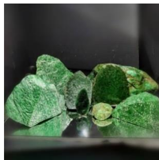
ภาพที่ 14 หยกม่อ ซิท ซิท

14. หยกม่อ ซิท ซิท (Maw sit sit) หรือ หยกคลอโรเมลานิต์ (Chloromelanite Jade) เป็นชนิดที่อยู่ในกลุ่มแร่ที่เป็นเจไดต์ แต่ไม่นับเป็นหยก เนื่องจากมีสารอื่นผสมอยู่เยอะ มีลักษณะเป็นริ้วสีขาวพร้อมด้วยแร่ชนิดอื่นที่ผสมอยู่ด้วย