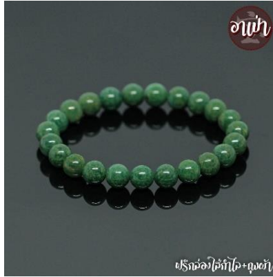
ภาพที่ 5 หยกแอฟริกัน (อาแปะ, ม.ป.ป.)

4. หยกแอฟริกัน (African Jade) เป็นหินสีเขียวเข้มของการเนตชนิดกรอสโซลา (Grossular Garnet) ซึ่งขุดได้ในประเทศแอฟริกาใต้ และมีลักษณะคล้ายกับ หยกเนฟไฟรต์ แต่มีสีเข้มกว่า และมีความทึบมากกว่า โดยสีเขียวเข้มมาจากฟอสซิลสาหร่ายนั่นเอง