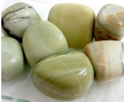
ภาพที่ 15 หยกเนยแข็ง

15. หยกเนยแข็ง (Butter Jade) เป็นชื่อของหยกที่จะพบที่ประเทศแอฟริกาใต้ มีสีเหลือง และไม่ใช้หยก ซึ่งจะเป็นแร่ในกลุ่มการ์เนตที่มีสีเหลือง คือ กรอซซูลาการ์เนต (Grossular Garnet)