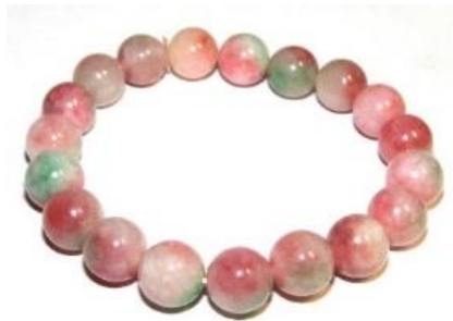
ภาพที่ 11 หยกสามสี (Thegemtree, 2560)

11. หยกสามสี (Candy Jade) เป็นหยกสีน่ารัก คือ มี 3 สี ได้แก่ ขาว เขียว และชมพู ซึ่งเกิดจากการเอาหินพื้นสีขาวมาย้อมสีเขียวและสีชมพู โดยหากโชคดีผู้ผลิตอาจใช้หยกเจดไตต์สีขาวมาย้อมสี หรืออาจใช้ซาซิโดไนต์สีขาวมาย้อมสีก็ได้เช่นกัน