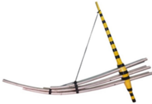
ภาพ 1 เฆ่ง (แคนม้ง) เครื่องดนตรีของกลุ่มชาติพันธุ์ม้ง