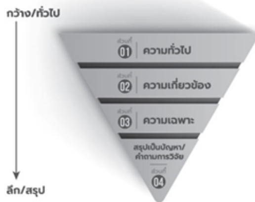
ภาพ 1 การเขียนความเป็นมาของปัญหา

จาก/ชื่อหนังสือ/(น./เลขหน้า),/โดย/ชื่อผู้แต่ง,/ปีพิมพ์,/สำนักพิมพ์/(URL)/ลิขสิทธิ์/ข้อความการอนุญาต From/BookName/(p./ PageNumber),/by/ Author, A. A./Year./Publisher/(URL)/ Copyright/ Permission.